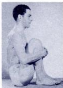
MAHA MUDRA (Part Three)