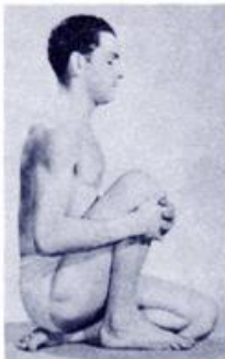
MAHA MUDRA (Part One)