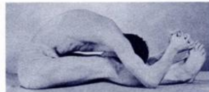
Fig. 5 (left) Fig. 6 (right)