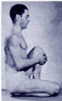
MAHA MUDRA (Part Two)