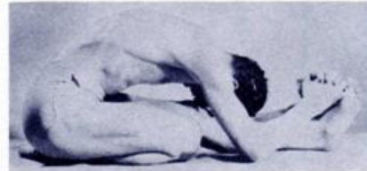
Fig. 3 (left) Fig. 4 (right)