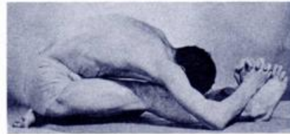
Fig. 1 (left) Fig. 2 (right)